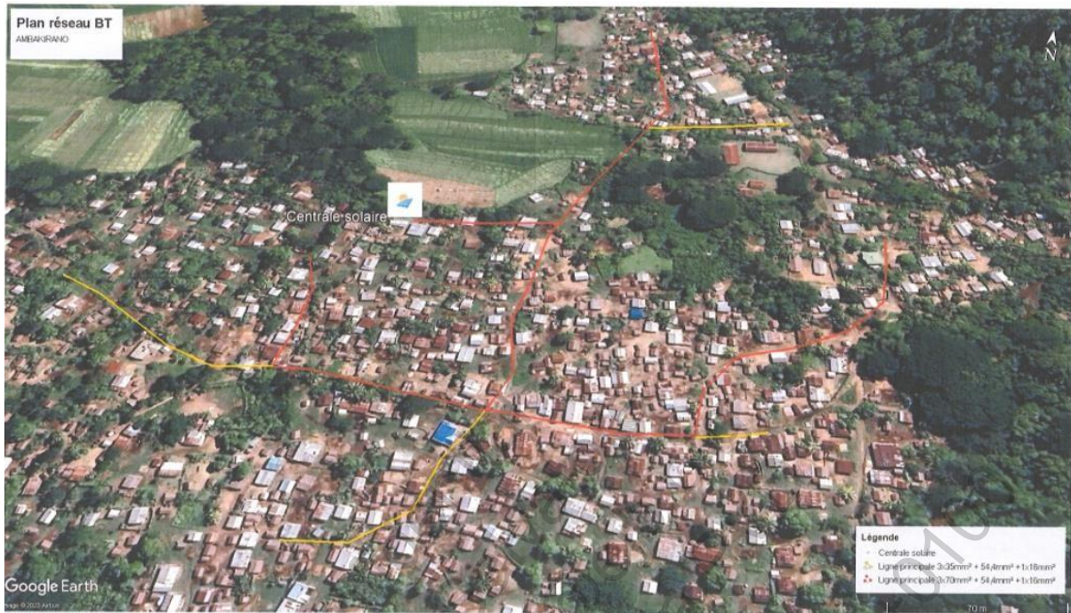
Plan de masse du site