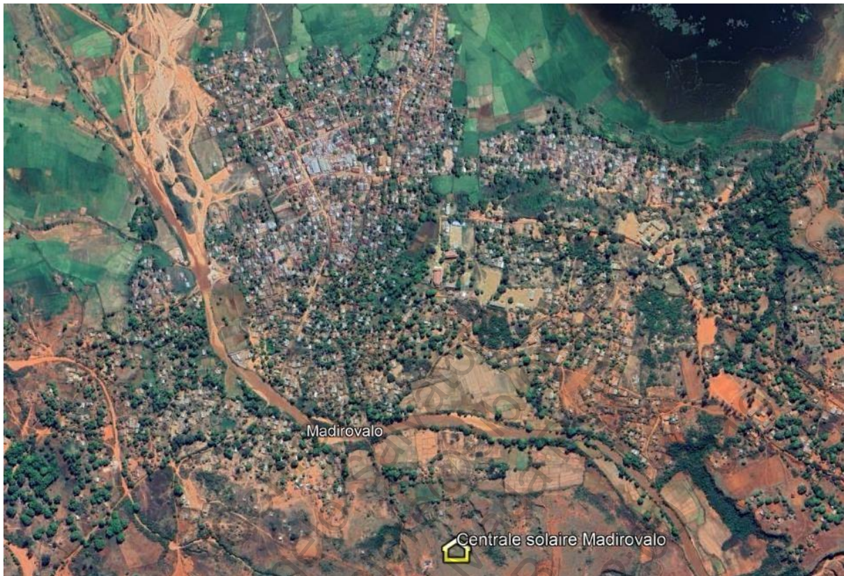
Plan de masse du site