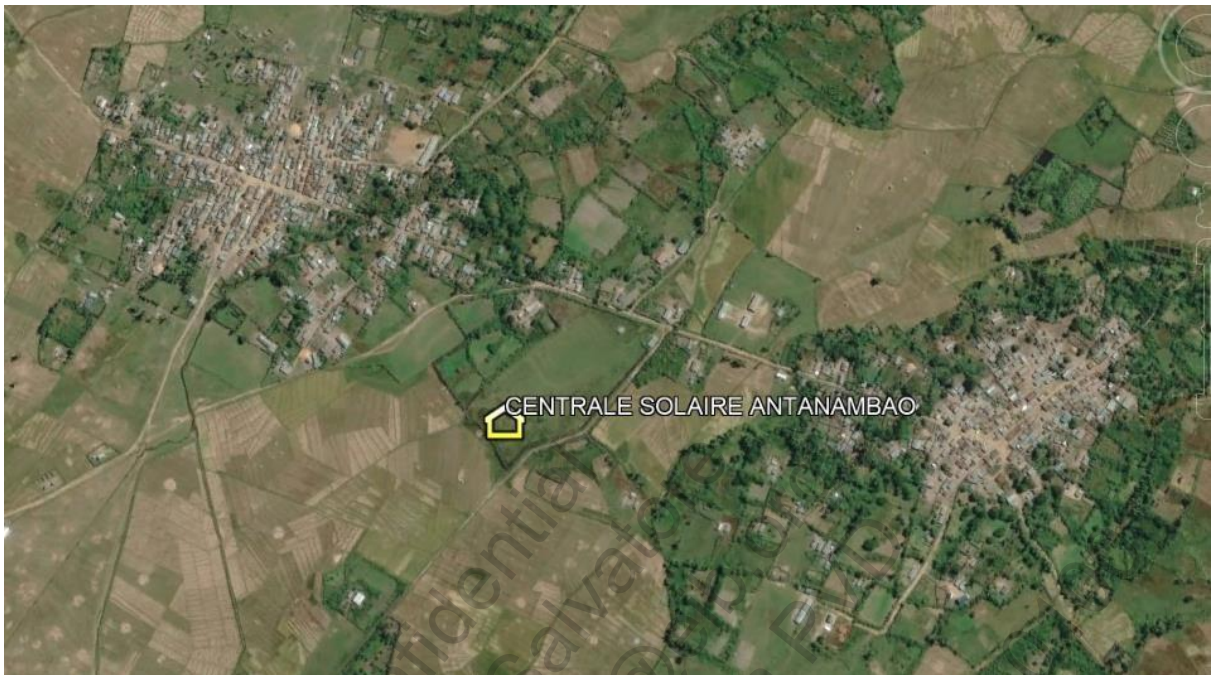
Plan de masse du site