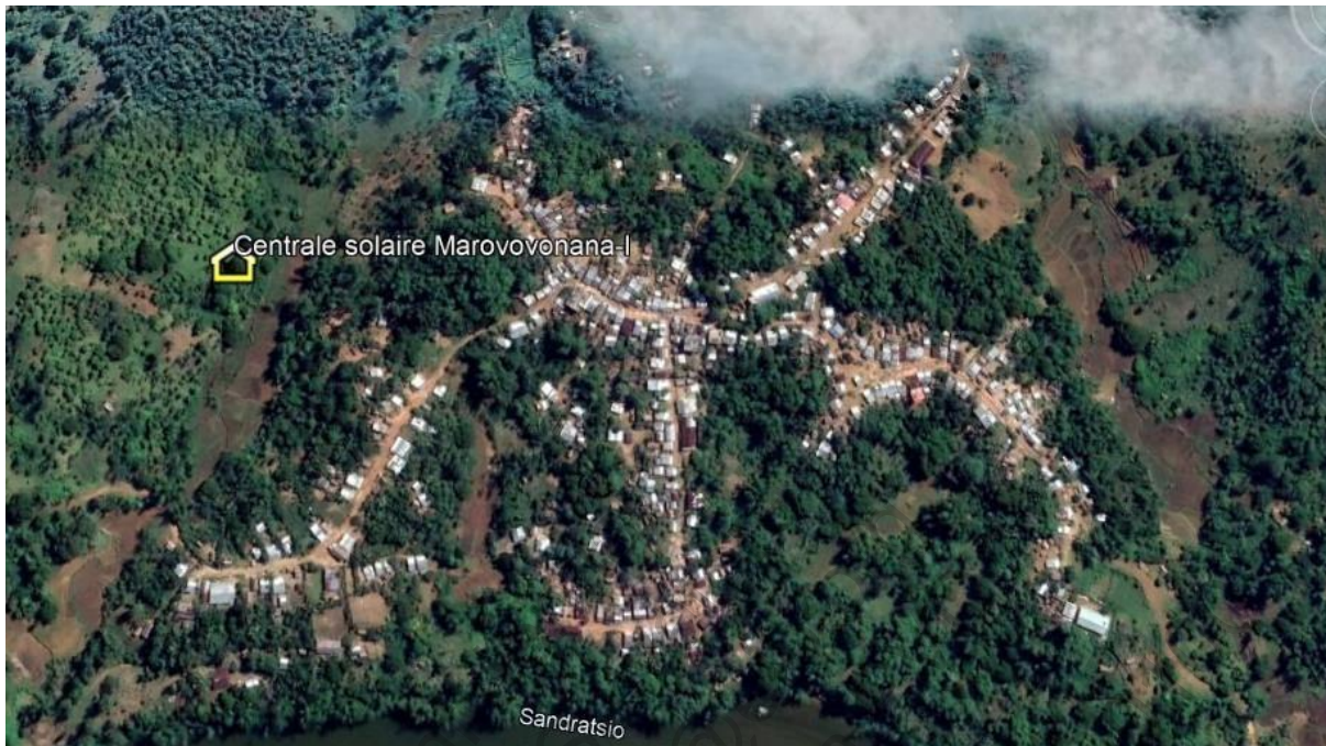
Plan de masse du site