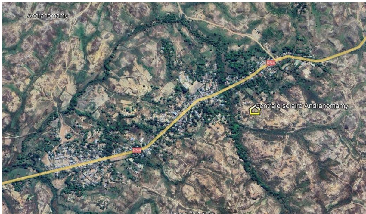
Plan de masse du site