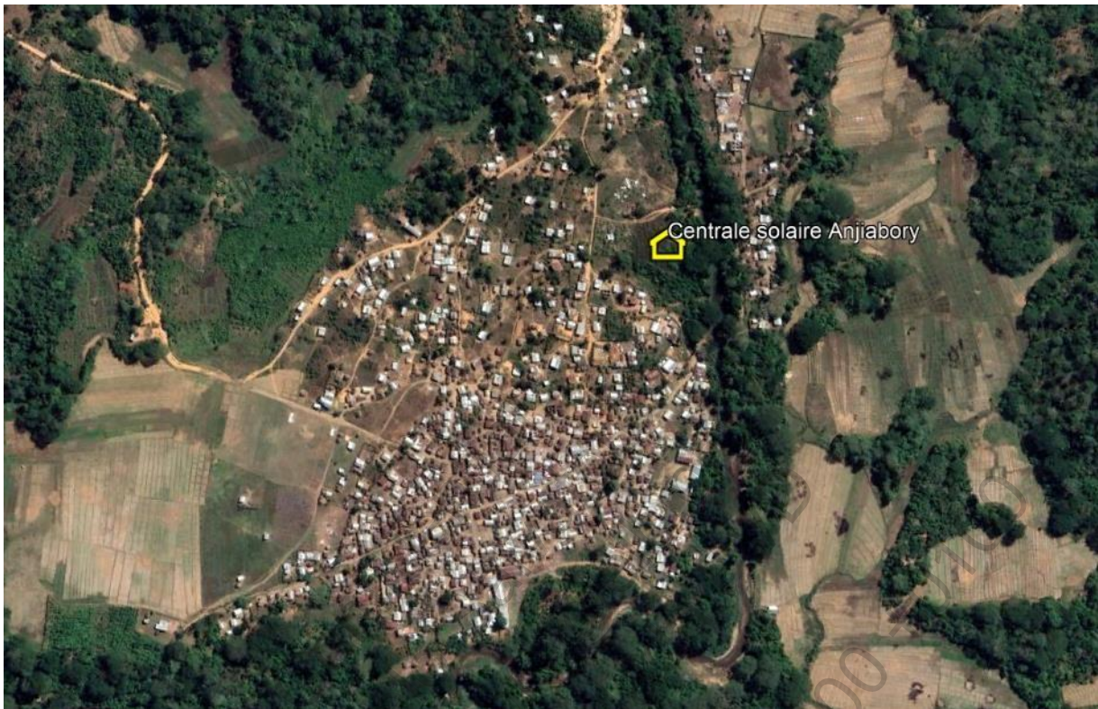
Plan de masse du site