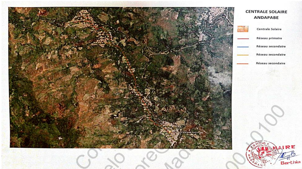
Plan de masse du site