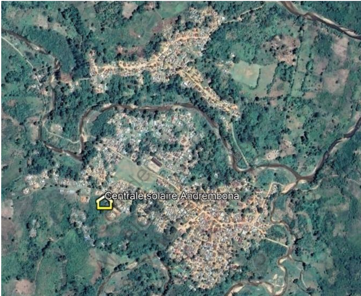
Plan de masse du site