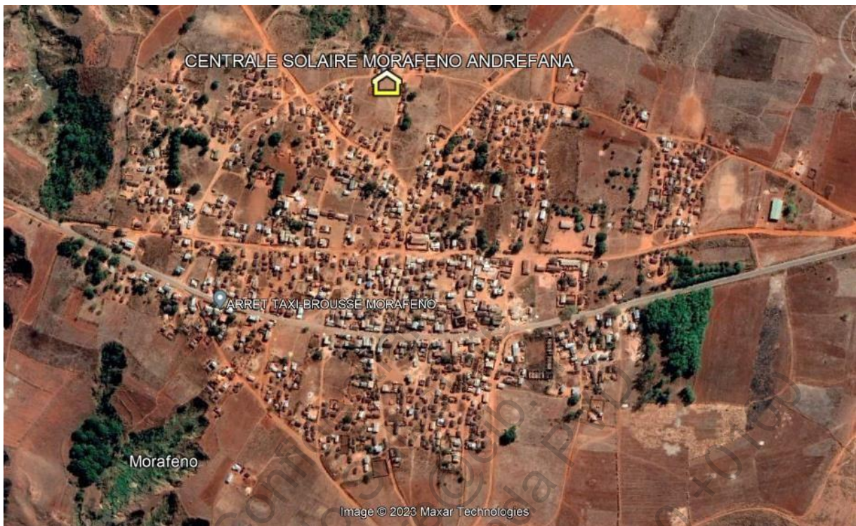
Plan de masse du site