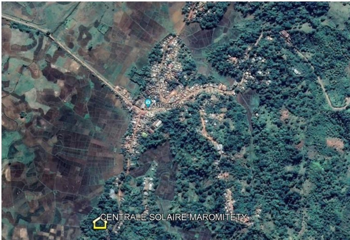
Plan de masse du site