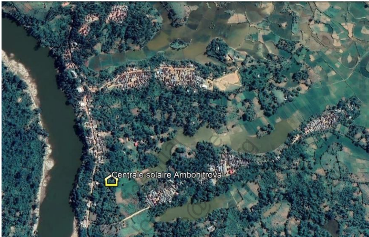
Plan de masse du site