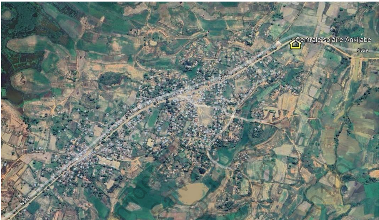
Plan de masse du site