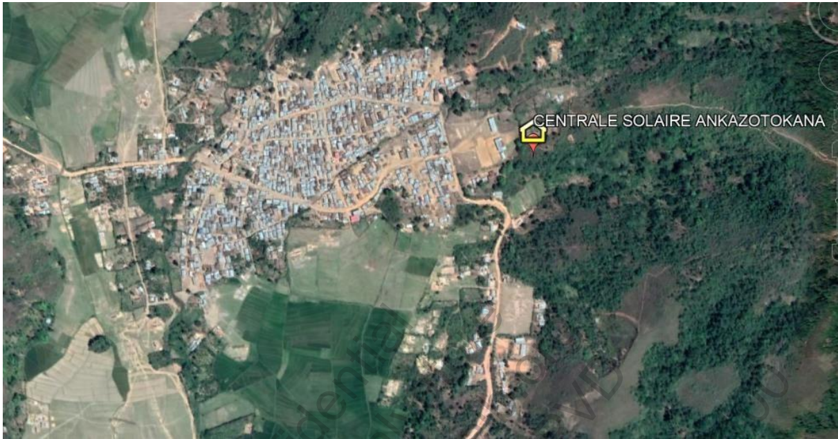
Plan de masse du site