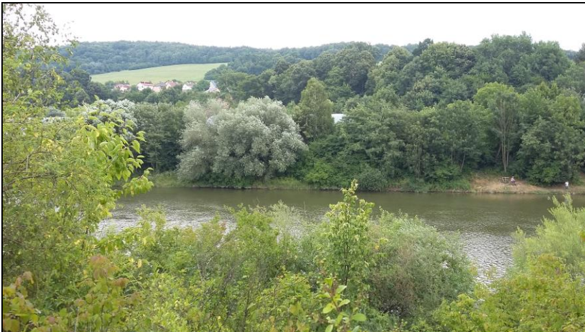
Miesto navrhovaného premostenia Nosického kanála železničným mostom z Púchova na ostrov Nosice v žkm 159,038