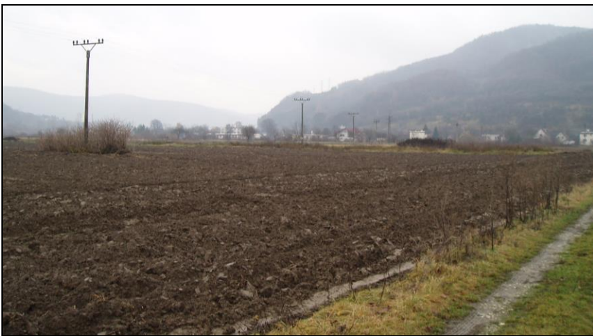
Pohľad na Nosický ostrov, kadiaľ bude trasovaná navrhovaná železničná trať v žkm 160,000 – 161,000