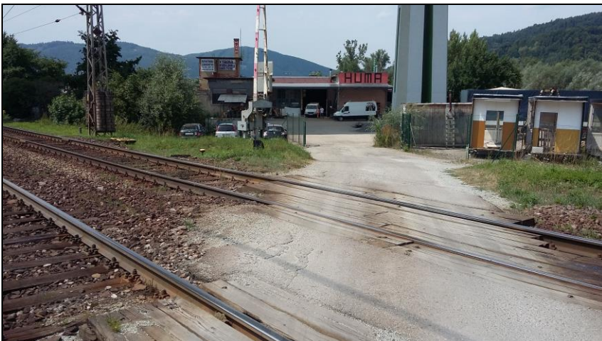
Miesto nového podchodu pre chodcov v Považskej Bystrici v žkm 169,740