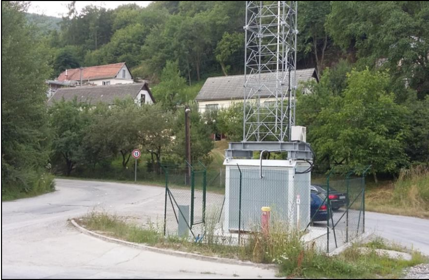
Miesto vybudovania východného portálu tunela Milochovo a prístupových ciest v Považskej Bystrici v žkm 166,125 (existujúce objekty bude nutné odstrániť)