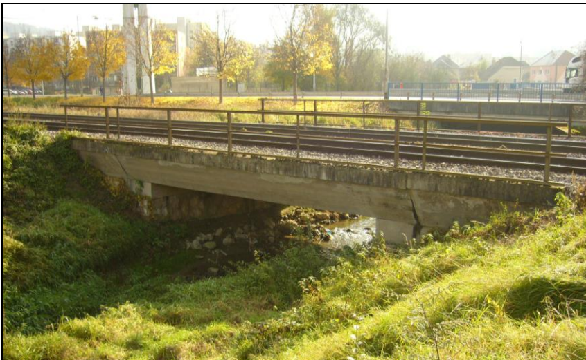
Most cez potok Mošteník v Považskej Bystrici navrhnutý na rekonštrukciu a na doplnenie cestným mostom v žkm 169,268