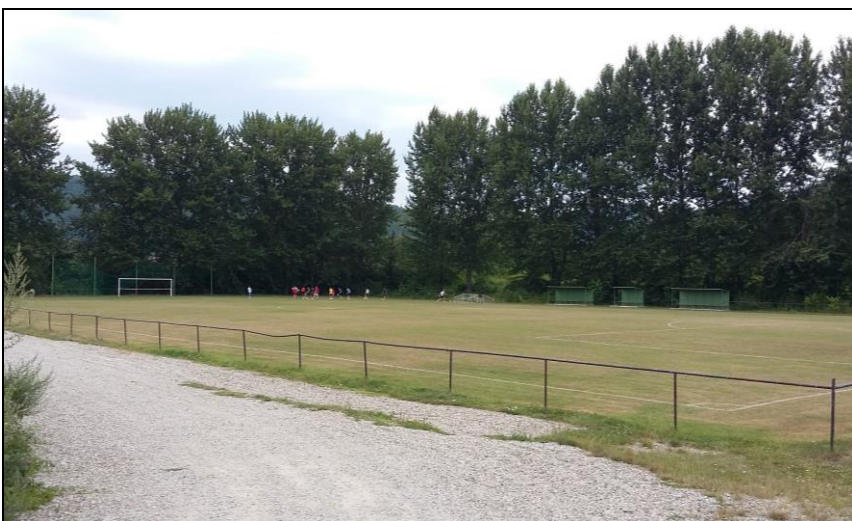
Miesto budúceho trasovania železničnej trate na ostrove Nosice v žkm 161,000 (pohľad na futbalové ihrisko, ktoré bude z dôvodu križovania preložené, ako náhrada bude vybudované nové futbalové ihrisko)