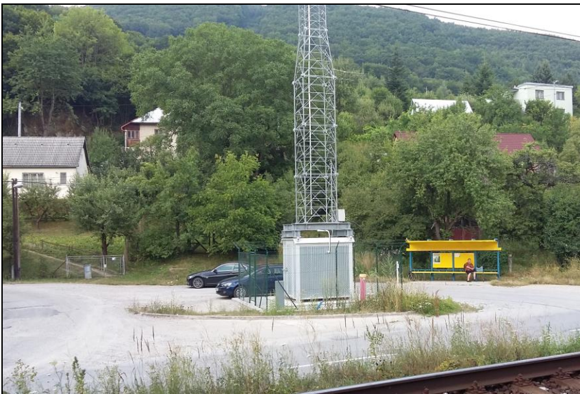
Miesto vybudovania východného portálu tunela Milochovej a prístupových ciest v Považskej Bystrici v žkm 166,125 (existujúce objekty bude nutné odstrániť)