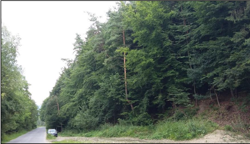
Miesto vybudovania západného portálu tunela Milochovej v Považskej Bystrici v žkm 164,267